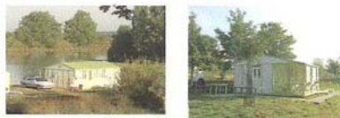
N° 1 « CLASS 3 ARRIERE